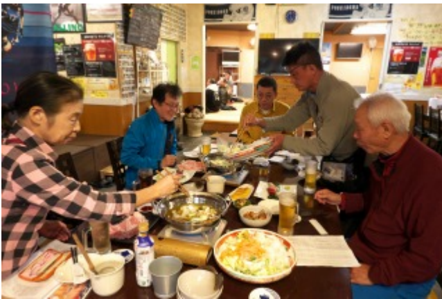
忘年会（伊豆海鮮や）