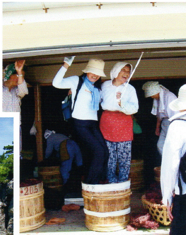
タルダンスを興じるAさん