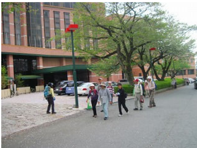
8. 時の栖 13:30

皆さんお疲れ様でした。 初対面同志の参加者も打ち解け、和気あいあいの楽しそうな今日のゴールでした。 今日の温泉は、裾野市「美人の湯」です。疲れた足を労いましょう。