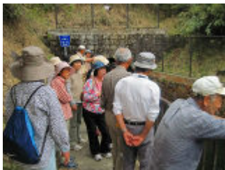
6. 深良用水 バスで現地まで送ってもらい見学。向こう側は、芦ノ湖だ。