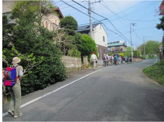
この辺は坂の町です