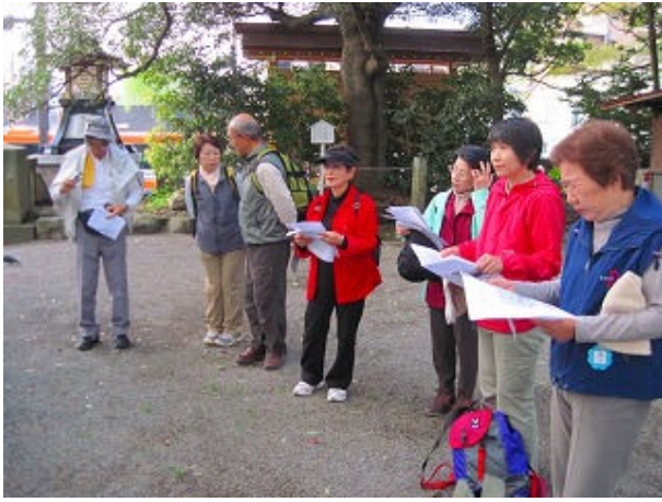
三嶋大社で出発時の説明です