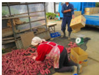
昭和初期 三島甘藷は日本一を誇った。

第1回・富士山一周ウォーキング。天気に恵まれ、良いスタートだ。桜も終わり、初夏の陽気だ。初顔合わせで、自己紹介と主催者の挨拶。拝殿・本殿に向かい、一年間のウォーキングの安全を祈願した。今年度は昨年度と違うルートに行く。三島裾野線に沿った別ルートだ。三嶋大社横から抜け、三島体育館、上岩崎公園、八乙女神社と生活道路を北進する。