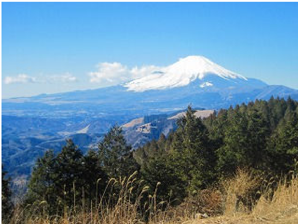
広々とした爽快な山頂から望む富士山は最高に綺麗です