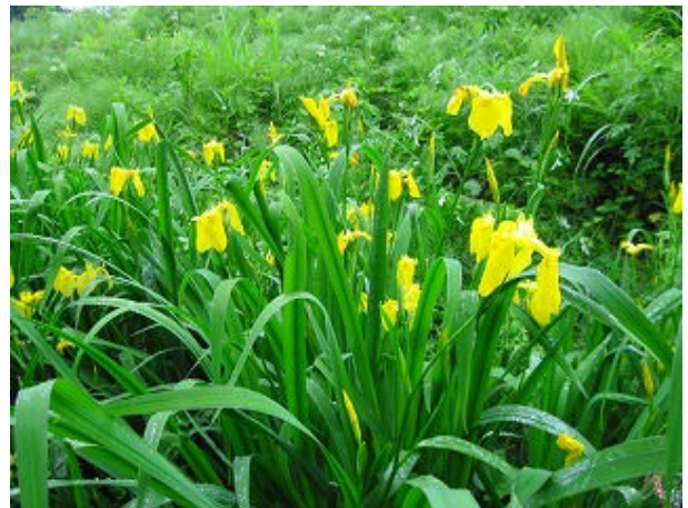
旧甲州街道・諏訪坂とカキツバタ