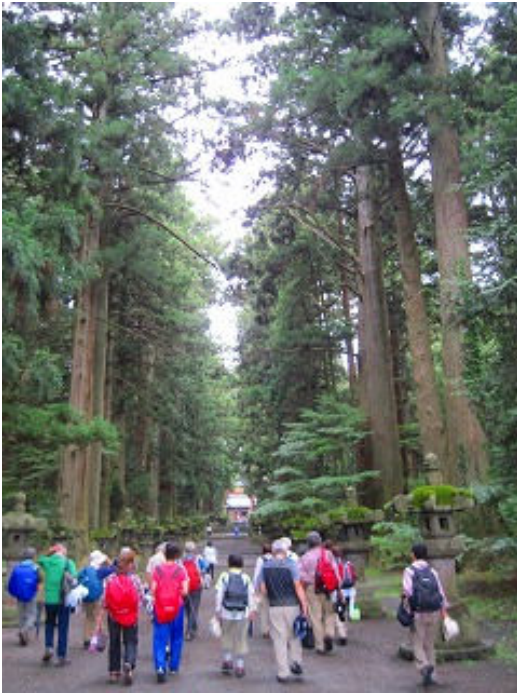
富士吉田浅間神社