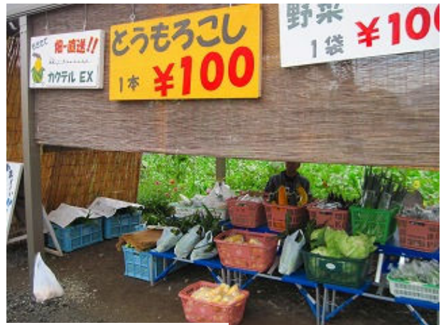
美味しいモロコシ