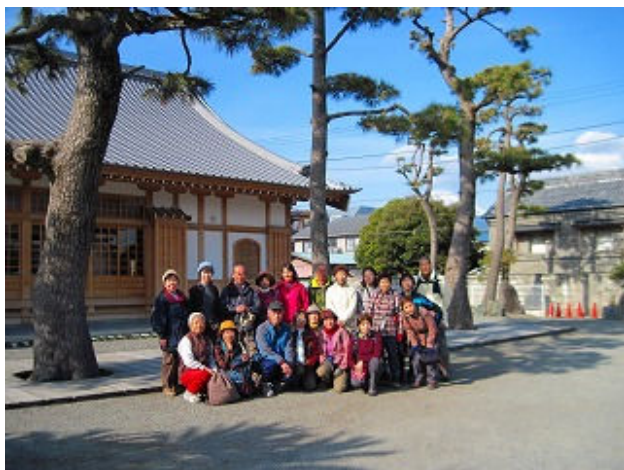
A班記念撮影 松陰寺