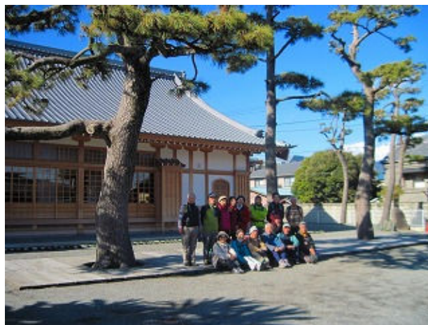
B班記念撮影 松陰寺