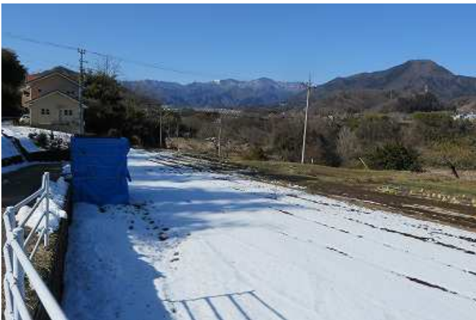
12:41 雪景色（右の山は、百蔵山）

この辺りは、昨年歩かなかった新コース。とても静かで気持ち良い道だった。地元の方も何人が散歩していた。畑仕事のオジサンと会話。タマネギの育ちがなかなか良かった。