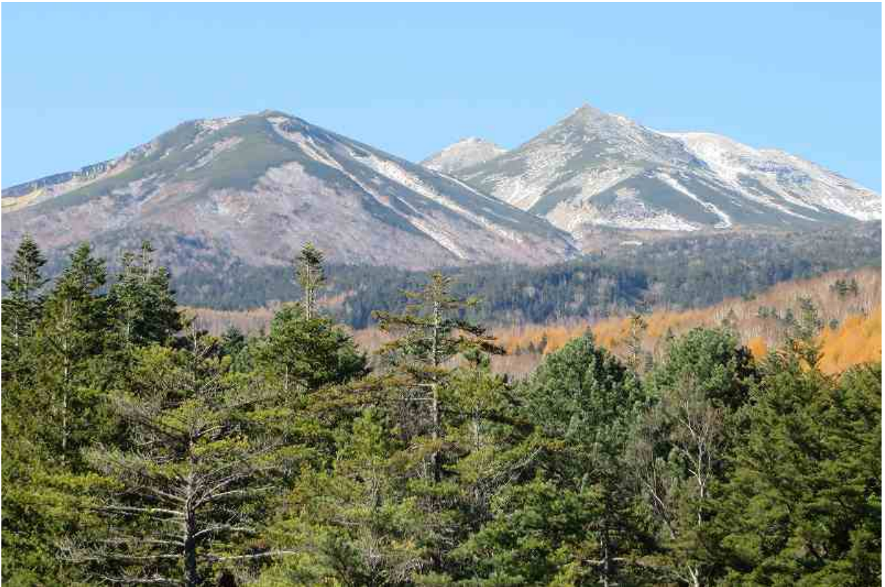
右ピークが最高峰・剣ヶ峰（3026m）