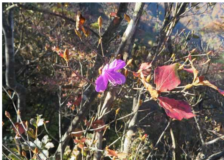
秋咲の三つ葉躑躅