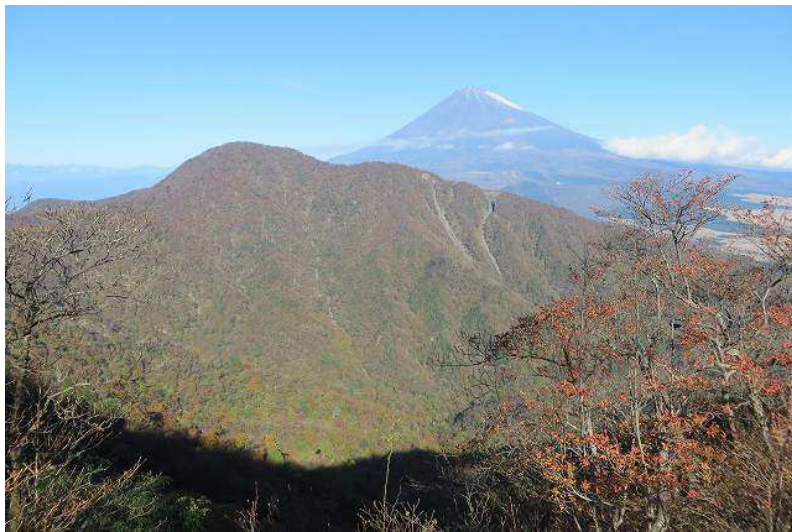
北尾根から越前岳 富士山