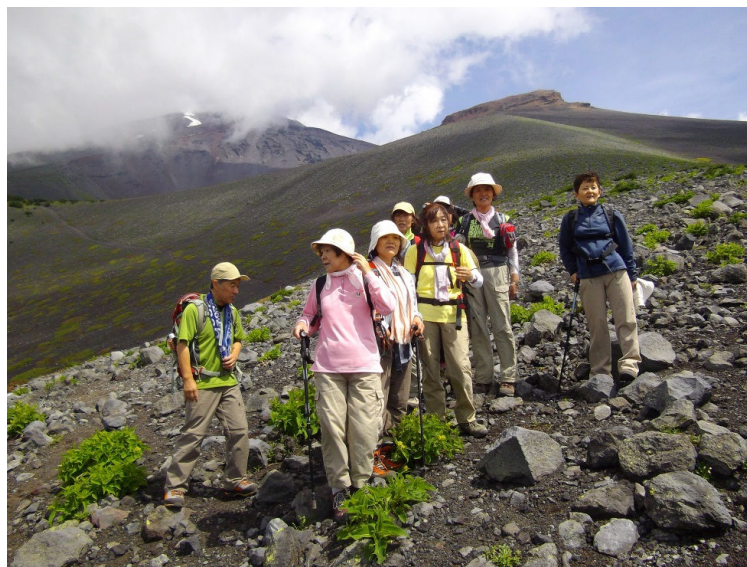
(女性陣は元気です)