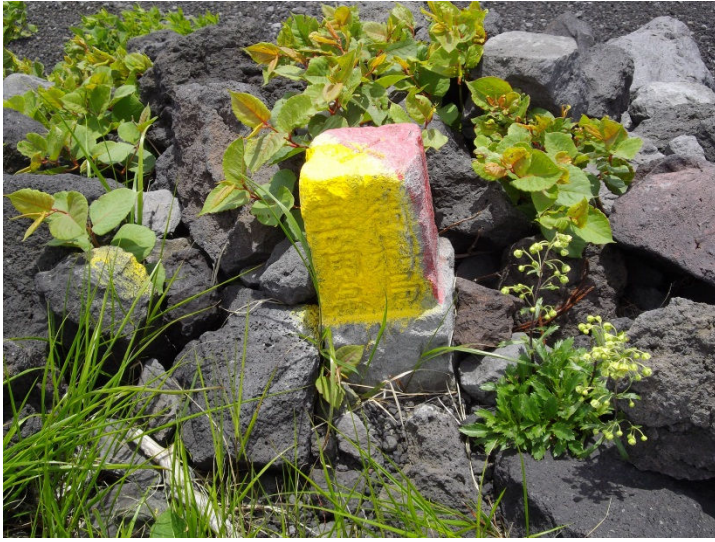
(ニツ塚・御料局三角点柱)