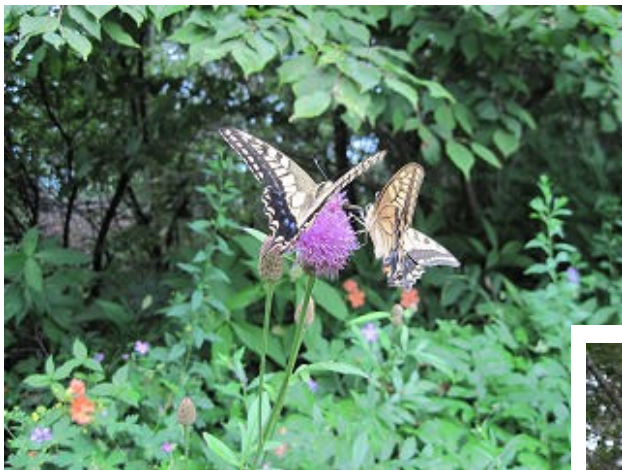
タムラソウに止る キアゲハ