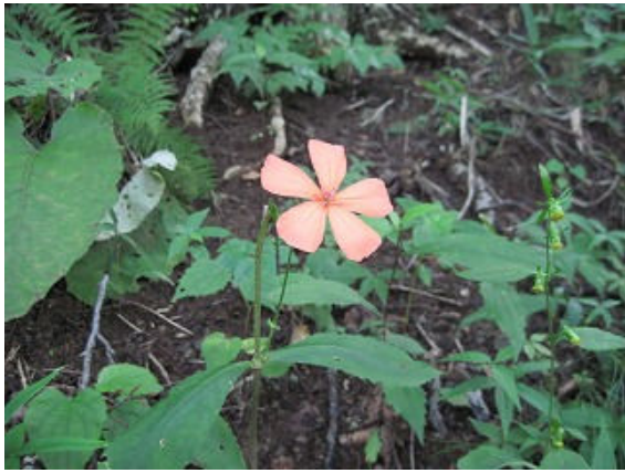
フシグロセンノウ