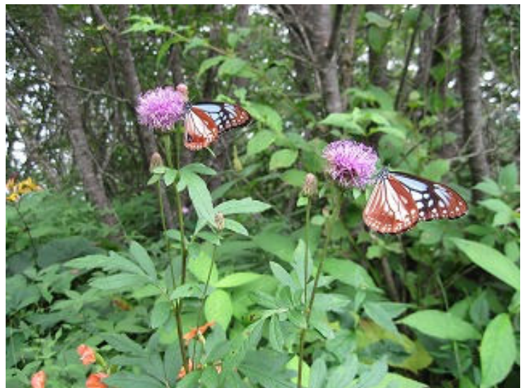
アサギマダラが たくさんいた