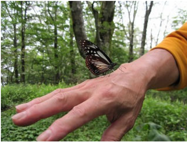
人なつっこい アサギマダラ