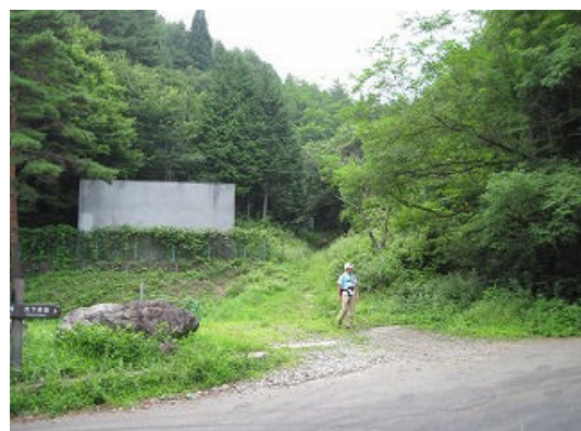
御坂トンネル南口