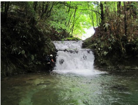
なかなか深い釜です