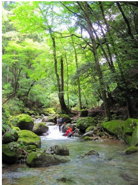
美しい日本の溪流