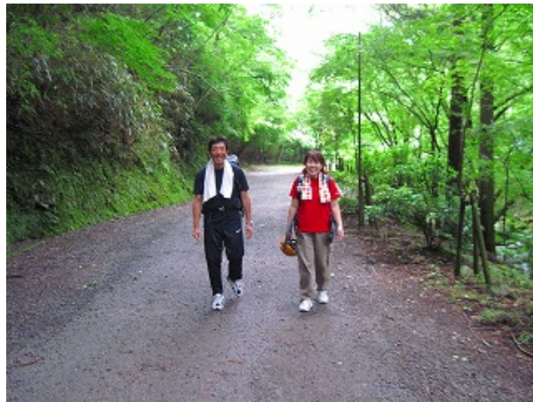
満足満足でルンルン 下山です