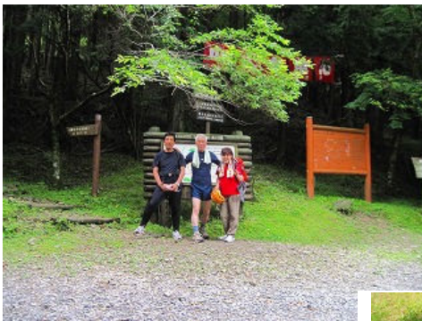
大川端で昼食です