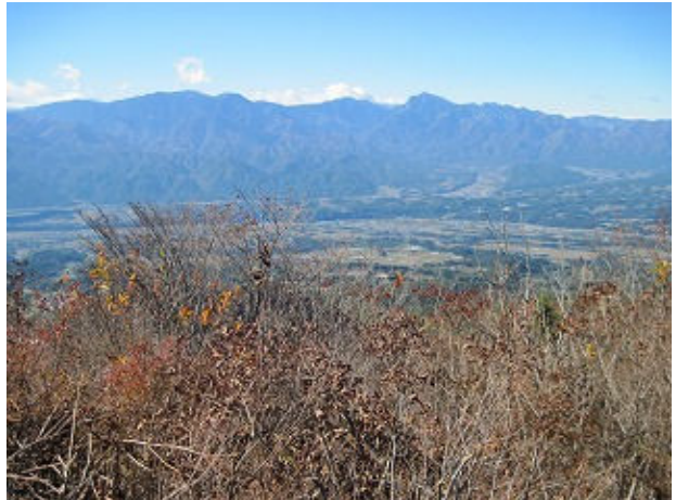
甲斐駒と北岳が少し