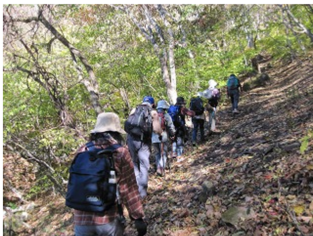
自然林が豊かな 気持ち良い上り