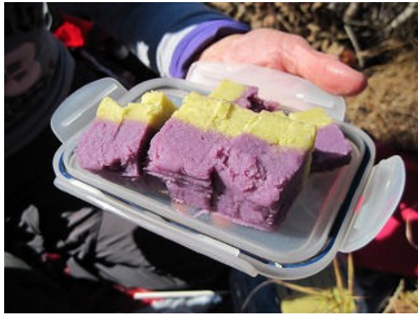
Aさんの二色イモ羊羹