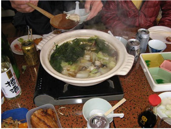
ウツボ鍋は絶品でした