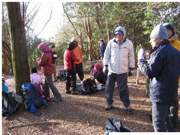
頂上は寒かったが、誰かさんはビアをやった!?

後藤CLをはじめ、皆さん、この1年間楽しく無事故で山に登れた事、感謝致します。ありがとうございました。来年もよろしくお願い致します。