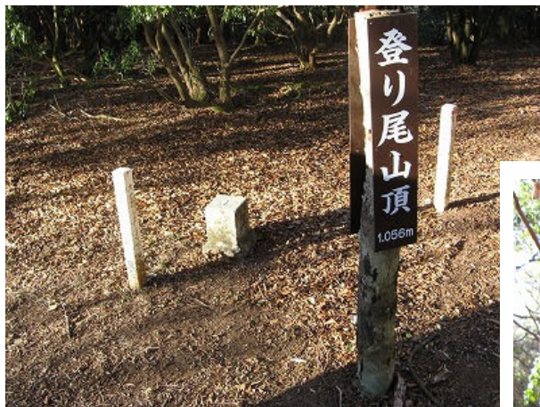
かつての山名「登り尾山」が直された

風はますますうなりをあげて吹きすさび、バランスを崩さないよう前傾姿勢を取りながら進む。あまりの寒さに指先がかじかんで、何の因果で年も押し詰まった今日この日にこんな寒い思いをしながら山を登っているのだろうか？と自問しながら黙々と登る。すこしきつい登りもしだいに緩み、登り尾山頂に到着。山頂は林の中の広場の様で、二等三角点が有るものの北東側に少し展望が有るのみ。強烈な寒さで止まってられない。集合写真を撮り15分程で下山開始。ヒメシャラの木が目立つ林を、白浜の民宿の温かいお風呂を思い浮かべつつ猛スピードで下る。35分程で真新しい道標の有る新山峠に至る。左折、寒天車道を目指す。