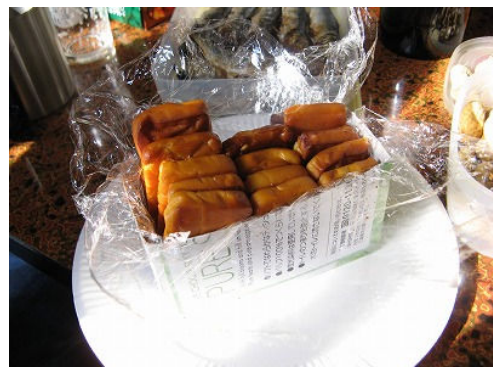
豪華で美味しい料理の数々