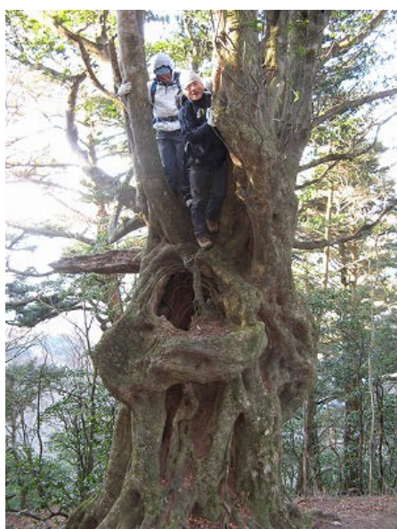
面白木に上るのは何方ですか〜??

7:15頃、車道をそれて右へと入り登って行く。ほどなく下り道になり小さな沢にでる。そのまま沢を登る。チョロチョロと水が流れ滑りやすく登りにくい。