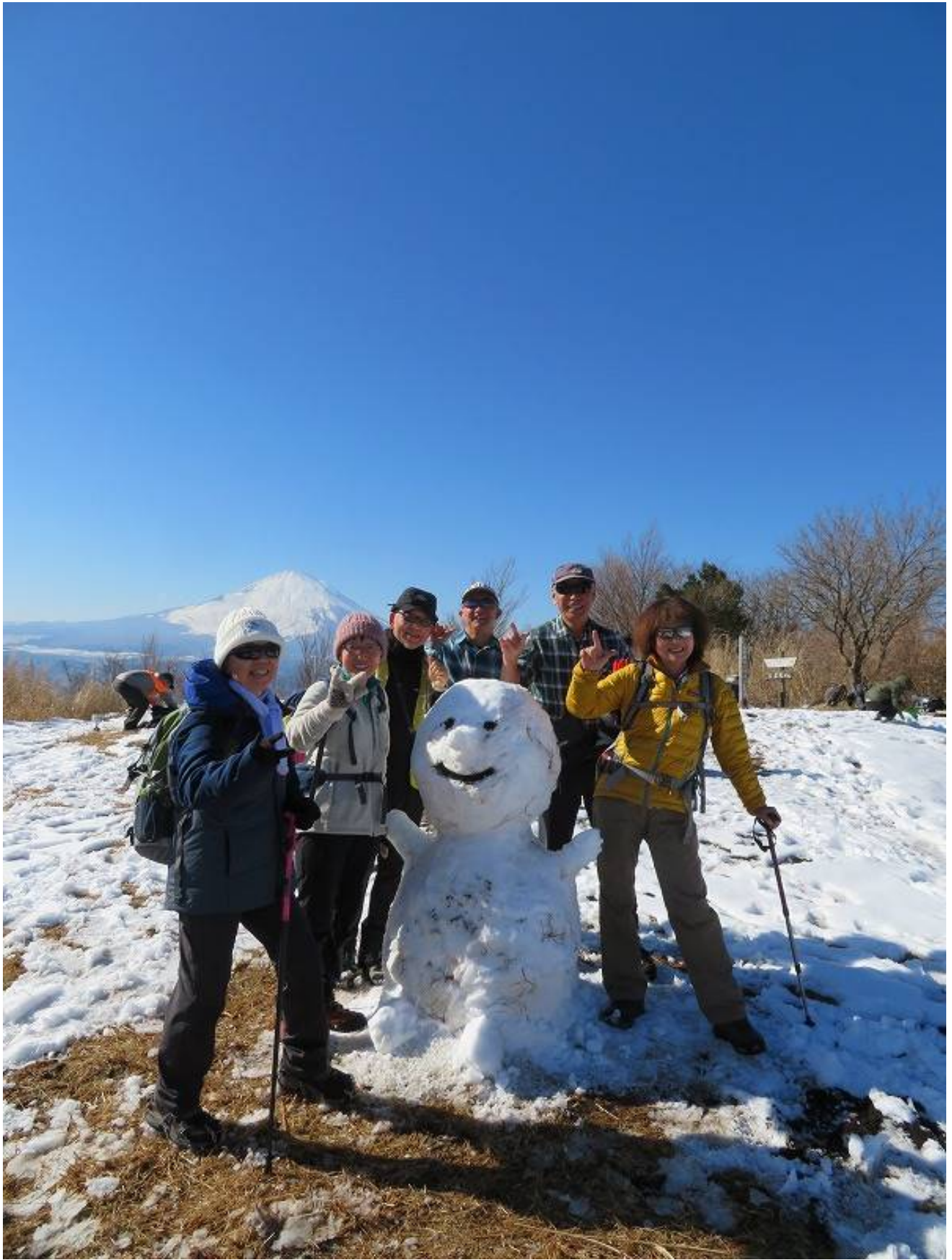
オジ・オバも元気イッパイだぜ～