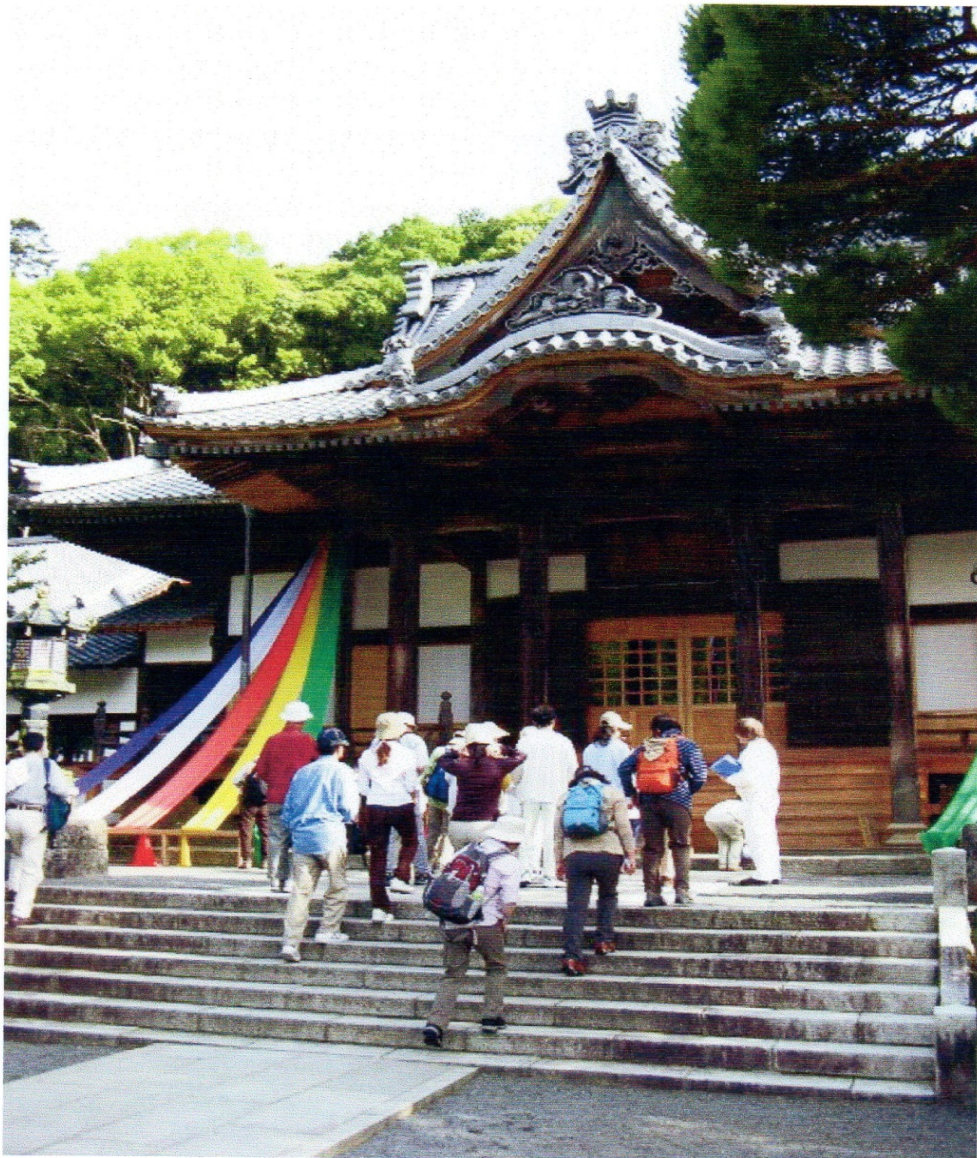
八十八番札所の修禅寺で結願を祈願する