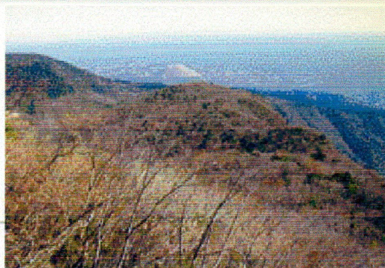
東尾根から伊東大室山を見る