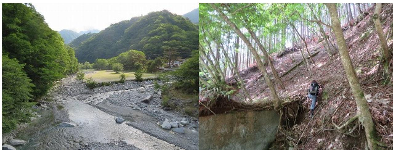
大堰堤上の取りつき

今回は、上権現山の北東尾根バリエーションを狙った。西丹沢自然教室に着くと駐車場は満杯。何か行事と聞けば、「何もない」だった。昨今の「登山ブーム」である。少し下って橋の袂に駐車した。