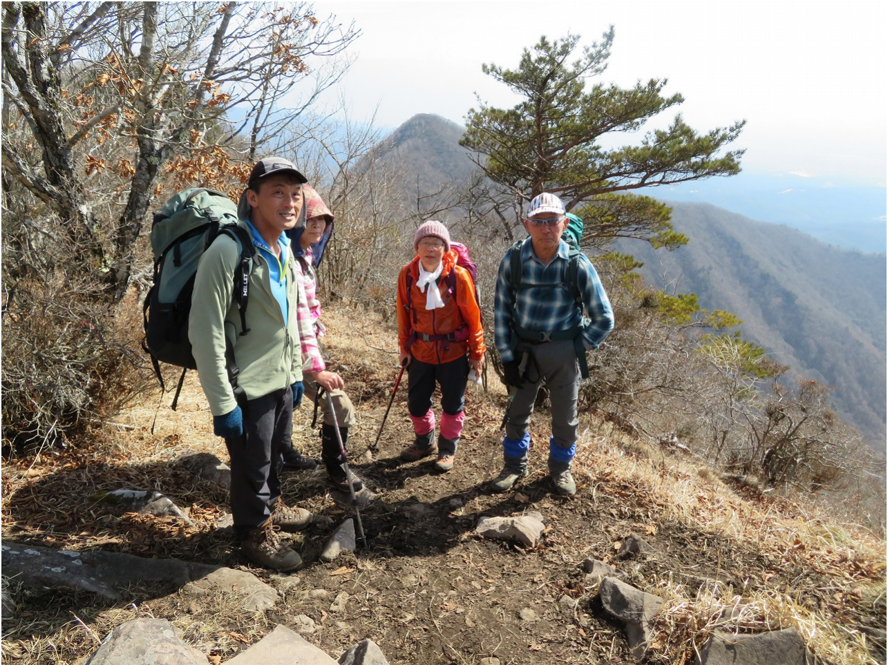
金ヶ岳（後ろのピークは、茅ヶ岳）

昼食後、金ヶ岳まで実に苦しい上りだった。やはり、昼食は「その後、上りがない場所」で摂るべきだ。 1時間の遅れが災いだった。