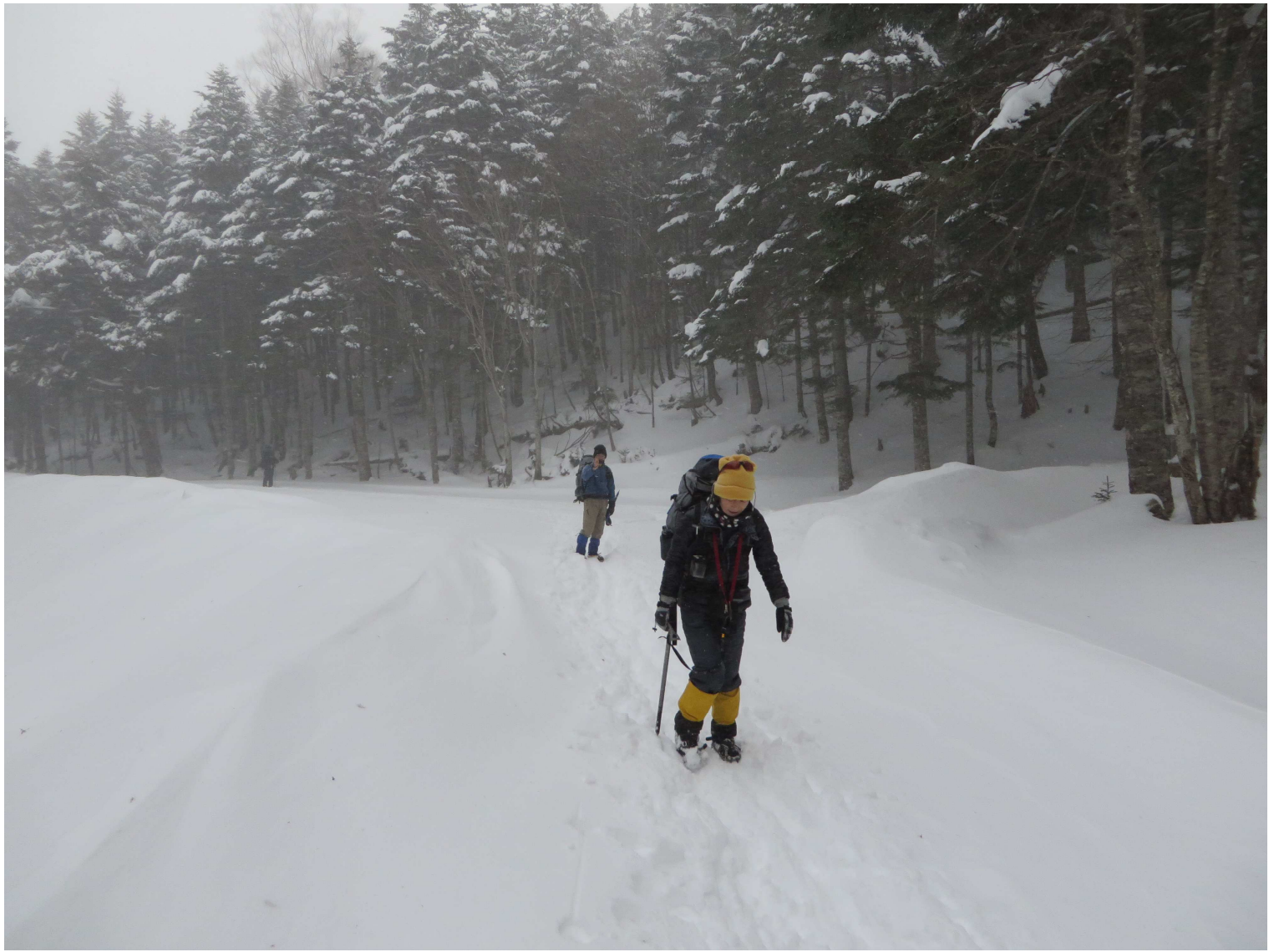
北沢峠 こもれび山荘