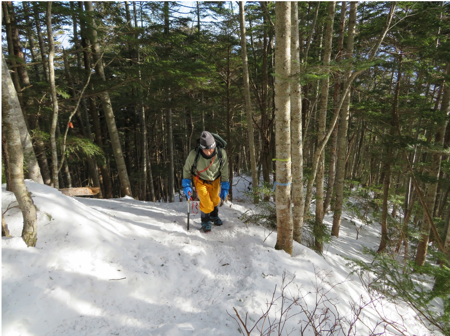
上・杉添尾根初登山のI君