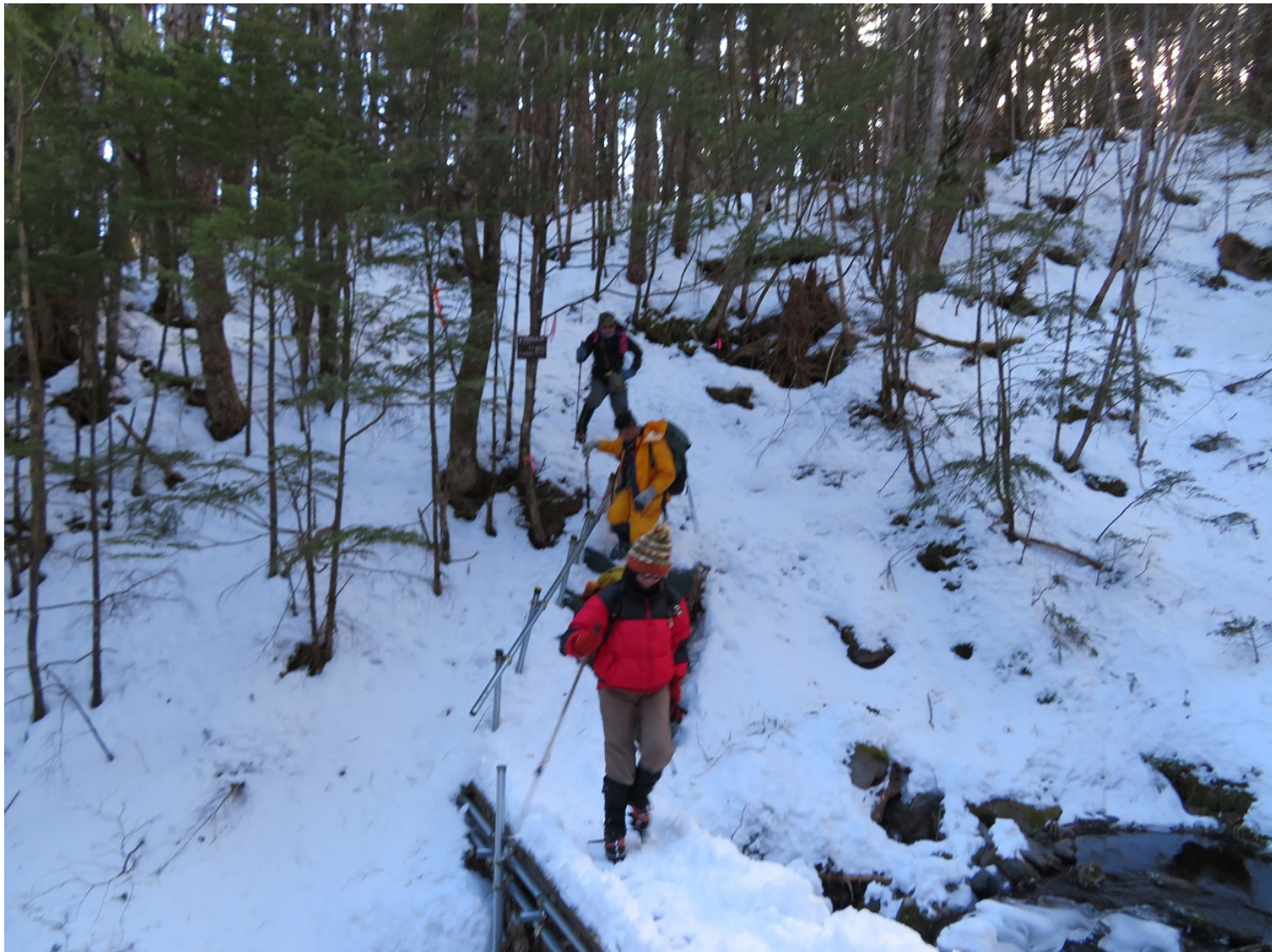
この日の下山は雪が多く歩き易かった