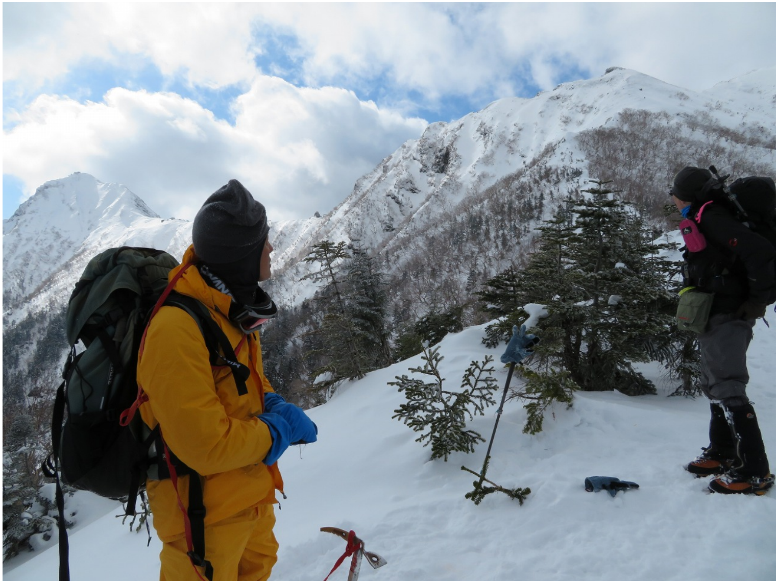
下・この日の2020のパパ