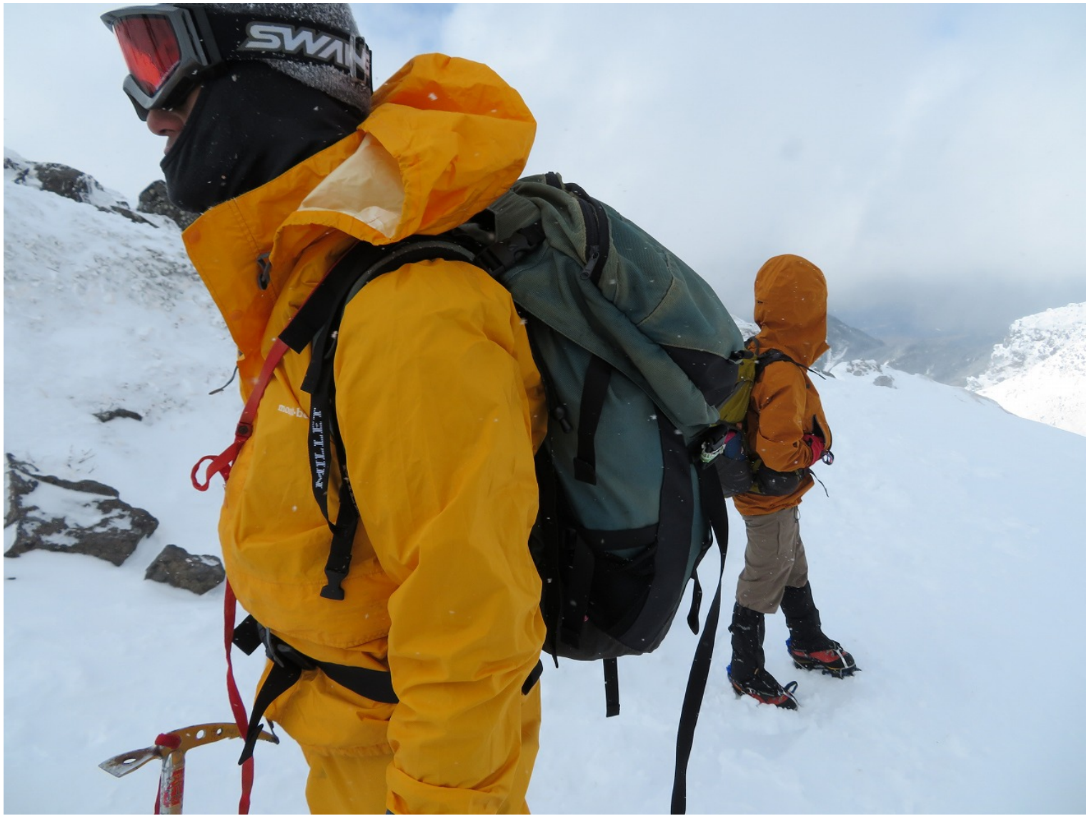
下・三叉峰（さんじゃほう）