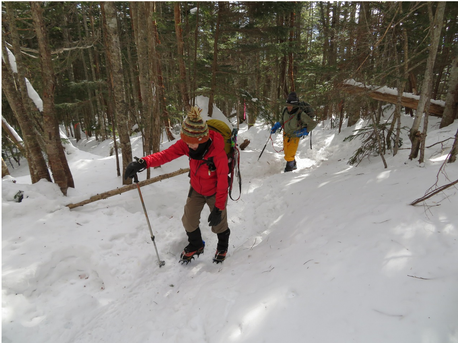
サクサク上る 新しい看板