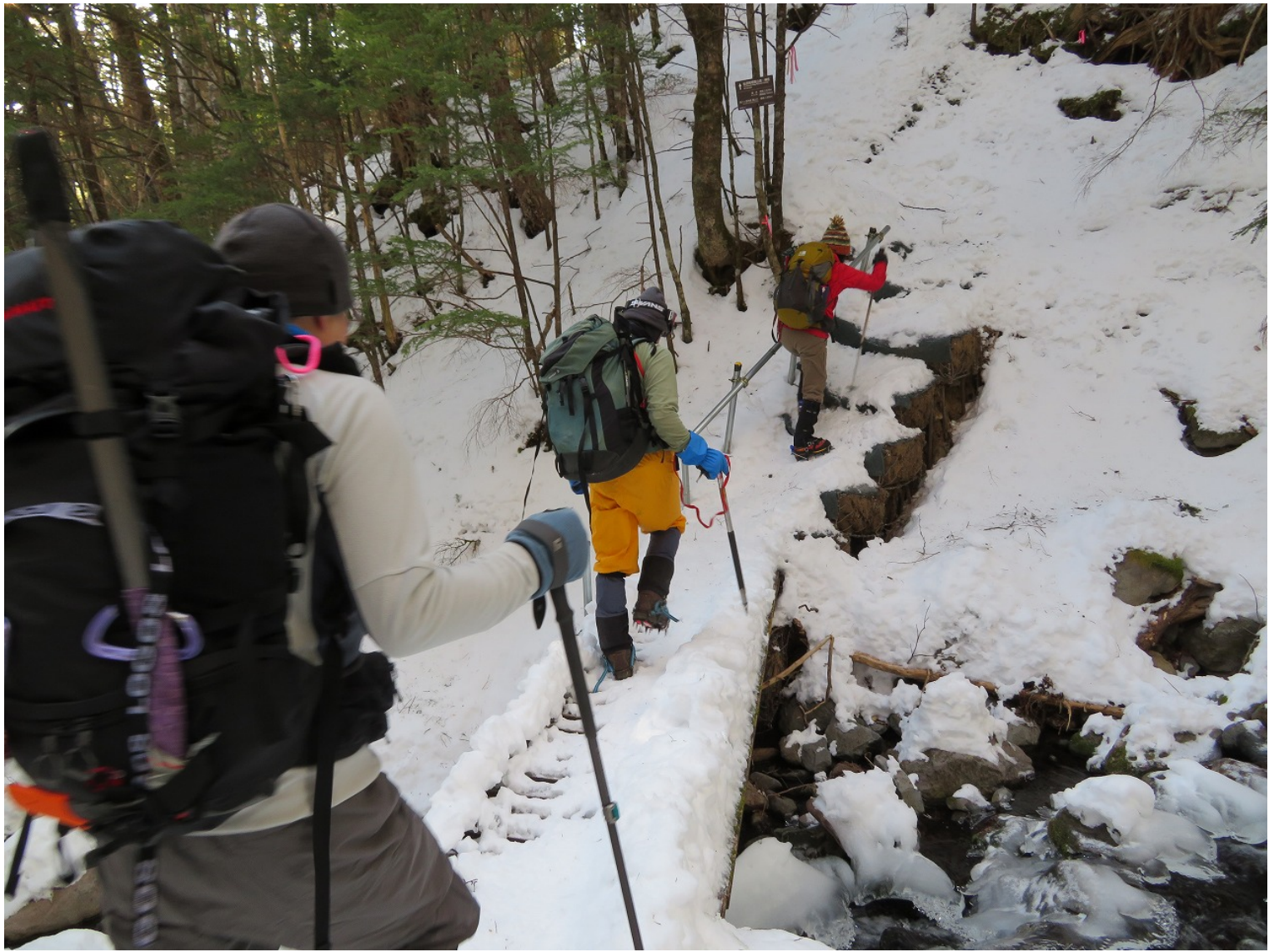
この日は、雪が多かった