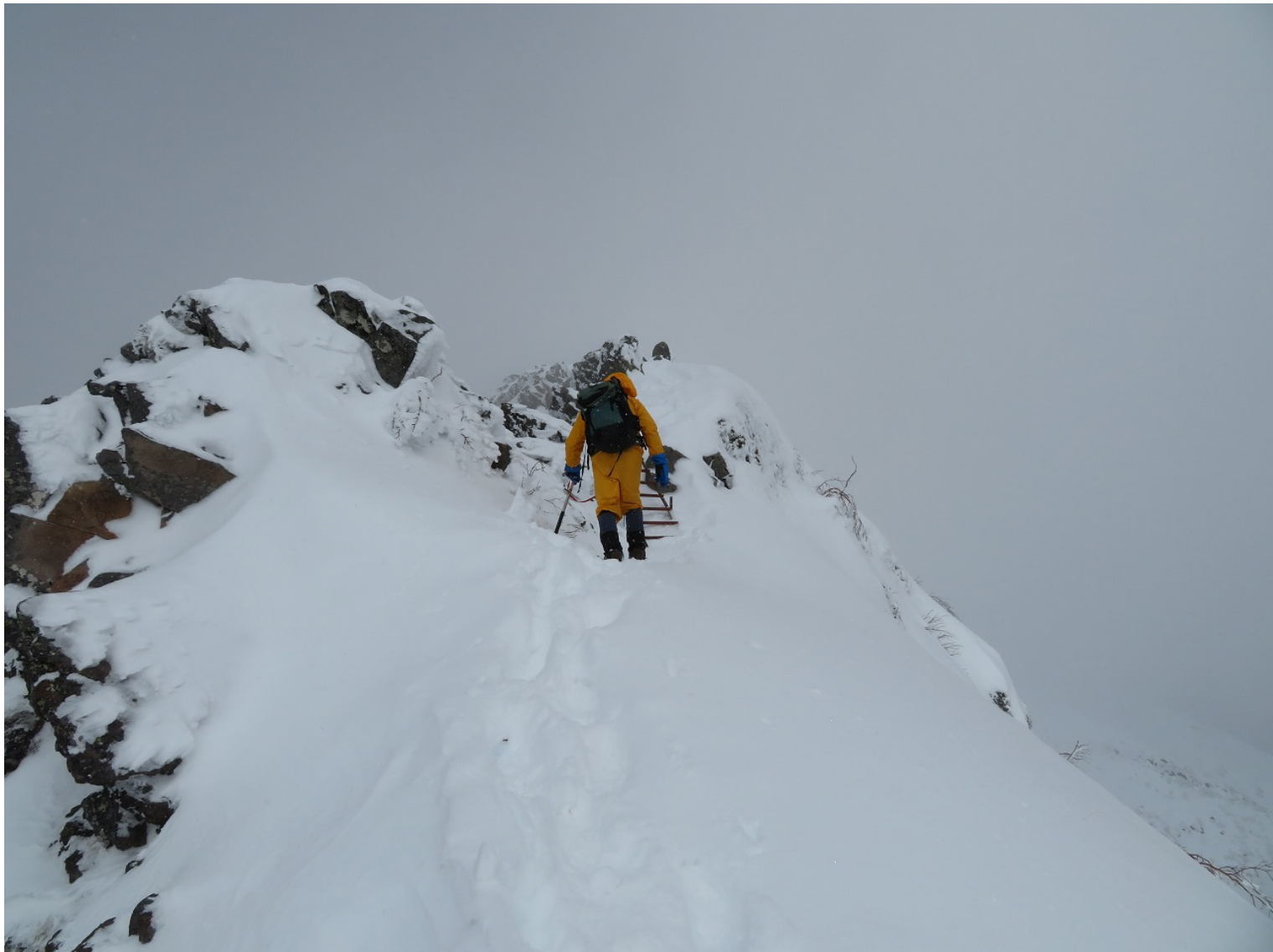
横岳直下、パパはここまで