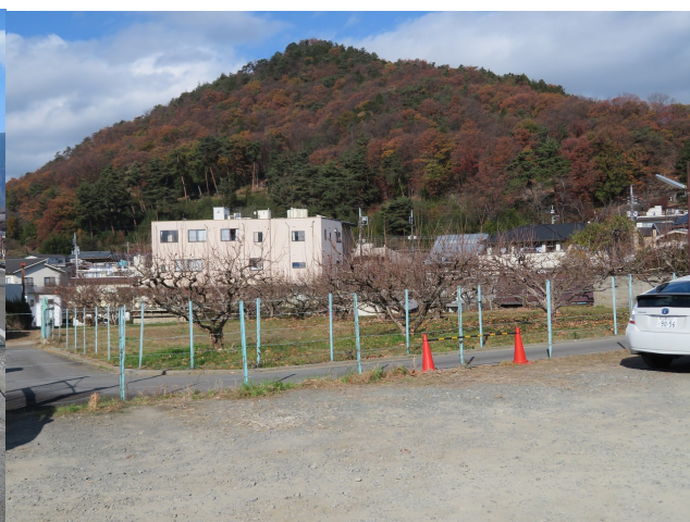
駅前から見た塩ノ山

駐車場から 15 分程歩くと登山口に到着。 標識は塩ノ山自然遊歩道入口となっており、登山というよりは地元の人々の散策コースという感じである。塩ノ山とは、