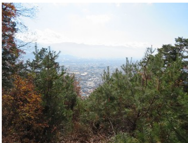
山頂からの南の展望