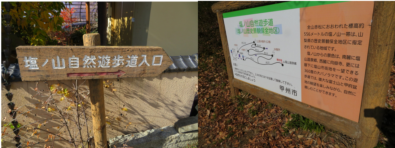
登山口（遊歩道入口）