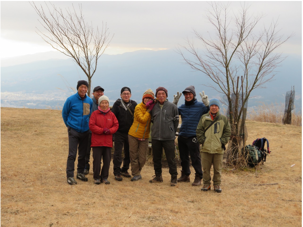
高松山頂上「あけましておめでとう！！」「一人酔ってます??」