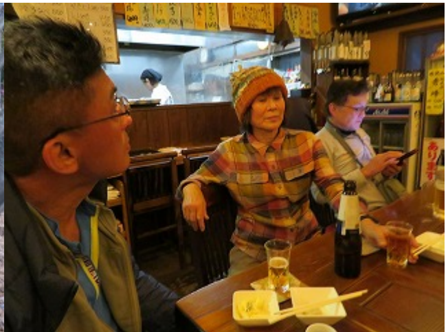
居酒屋「ポップ駅前屋」

長い道を歩き、ようやく山北駅。更に打ち上げで、駅前の居酒屋「ポップ駅前屋」に入る。なかなか感じがよい店だった。大瓶ビール600-は安い。日本酒は、丹沢の酒「秀峰」を飲んだが美味しかった。いい初登山でした。