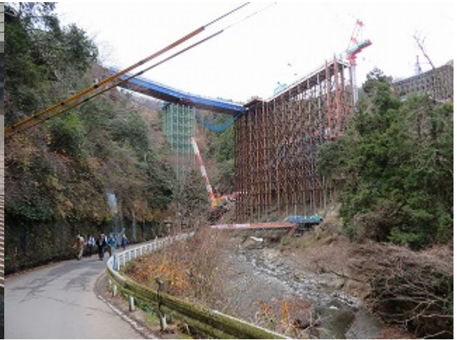
第二東名工事現場