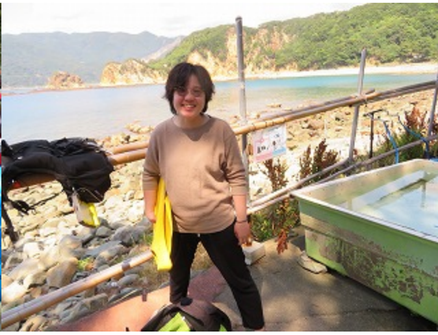
アクアラングの女子