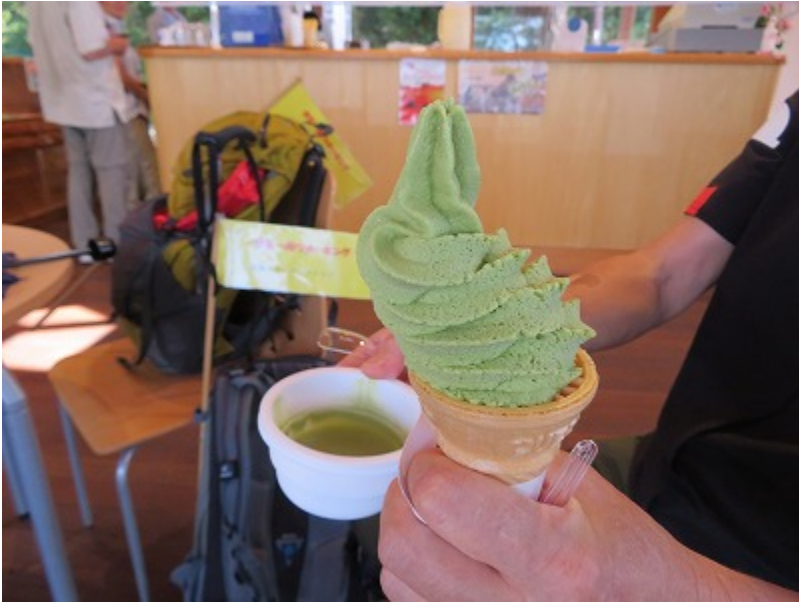
黄金崎の抹茶ソフト