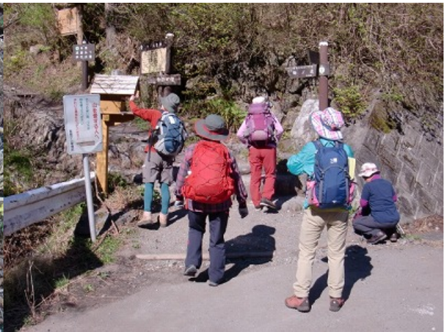
本格的な登山口で。