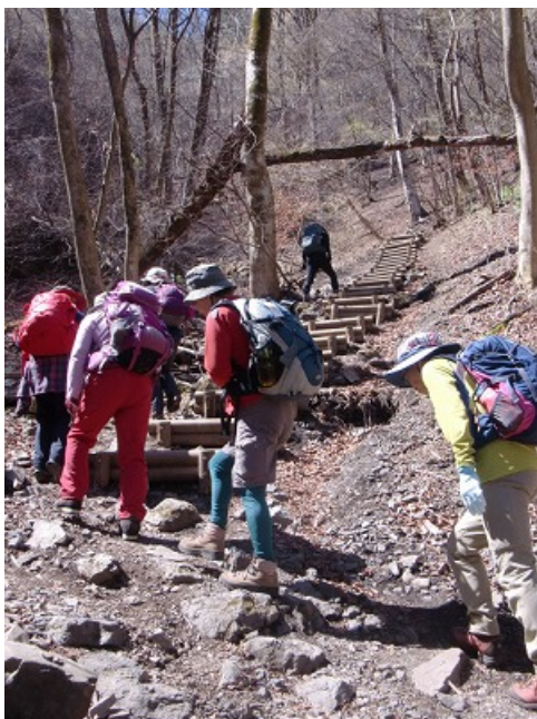
丸太の土留めを登って、あと一息？