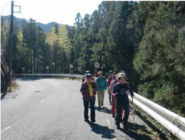
さわらびの湯登山口出発して・・・。

2019. 04. 16 (火) 奥多摩・棒ノ折山 (969m) 会員5名+一般2名