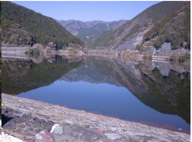
有馬ダム。湖面が静かで山が反映しています。