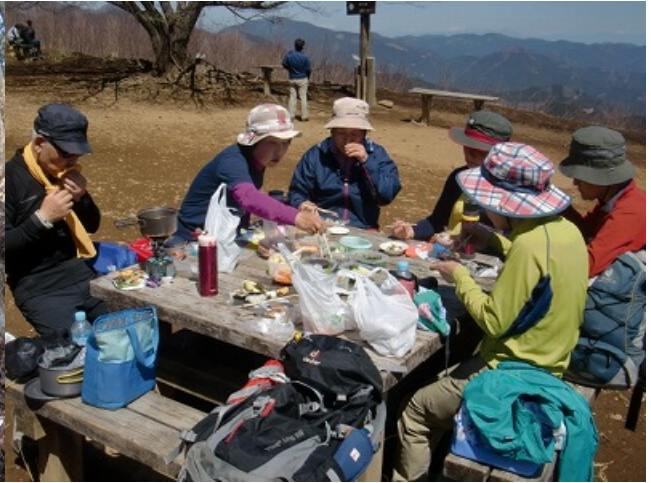
頂上着。展望は360° でもそんな事言ってもらえない。食べるに忙しい