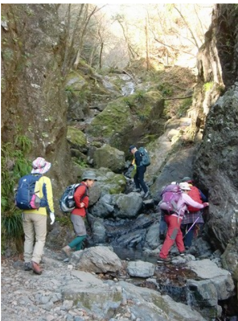
沢筋をつめていきます。