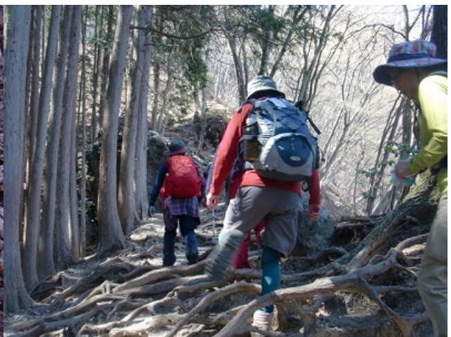
木の根の張り出したヤセ尾根を歩く。