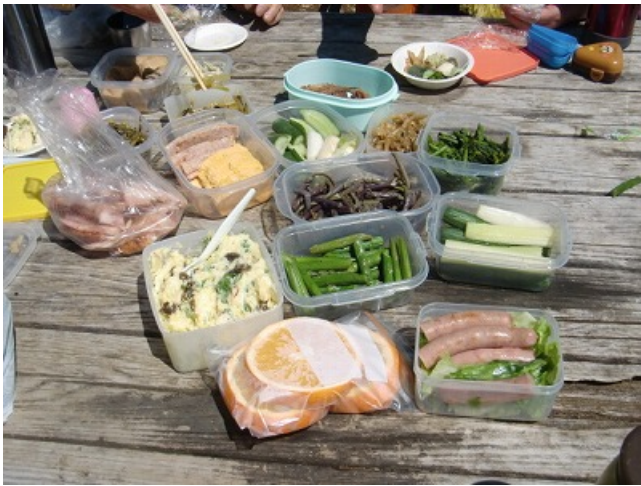
何時もながらの御馳走が並ぶ