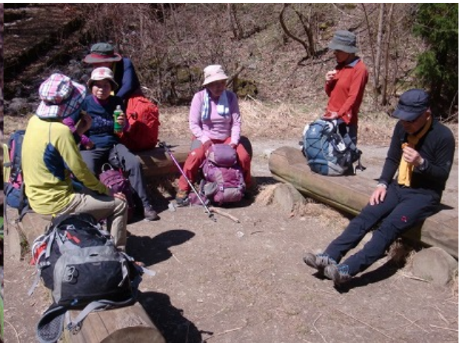
丁度中間地点の所で一休み・・・。