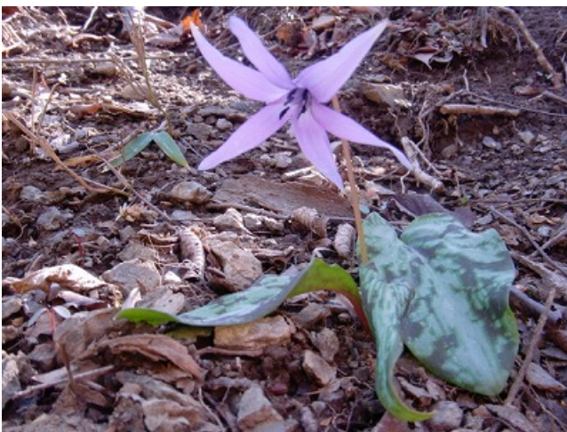
カタクリの群生地。