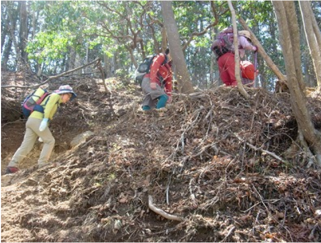
急登に喘ぐが・・・。