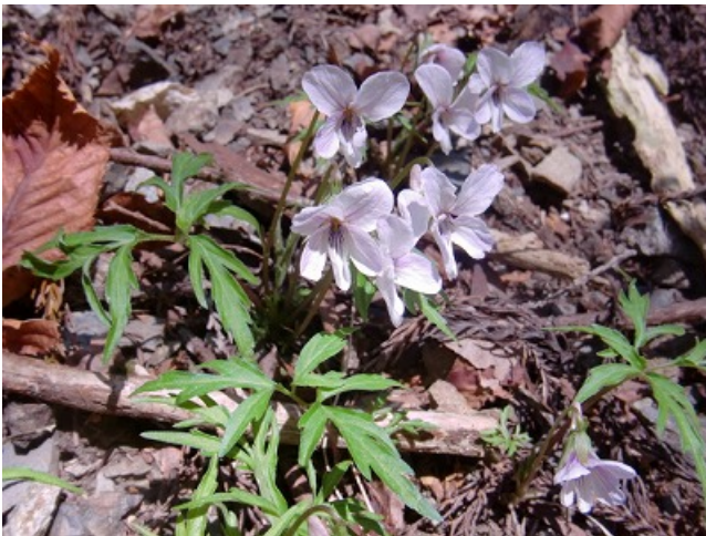
エイザンスミレがヒっそりと咲いていました。