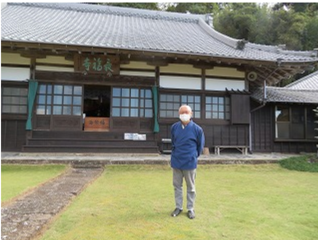
最福寺・廣澤住職