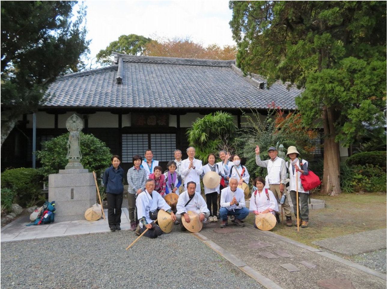
伊豆八十六番札所・安楽寺（伊豆市・土肥）

記念撮影後、「まぶ湯」を見学して終了。足湯に浸かったのは、私だけだった。（´艸`） 厳しい巡礼だったが、完全燃焼の日でした。合掌。