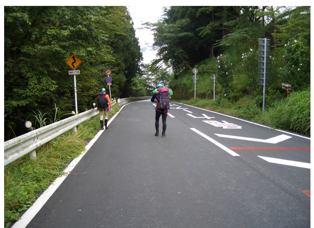
16日、沢の降り口に向かう