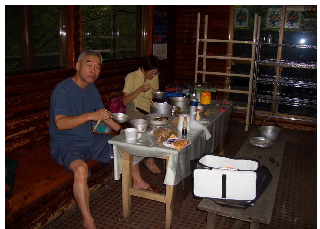
15日、二瀬ダムのピクニックステーション