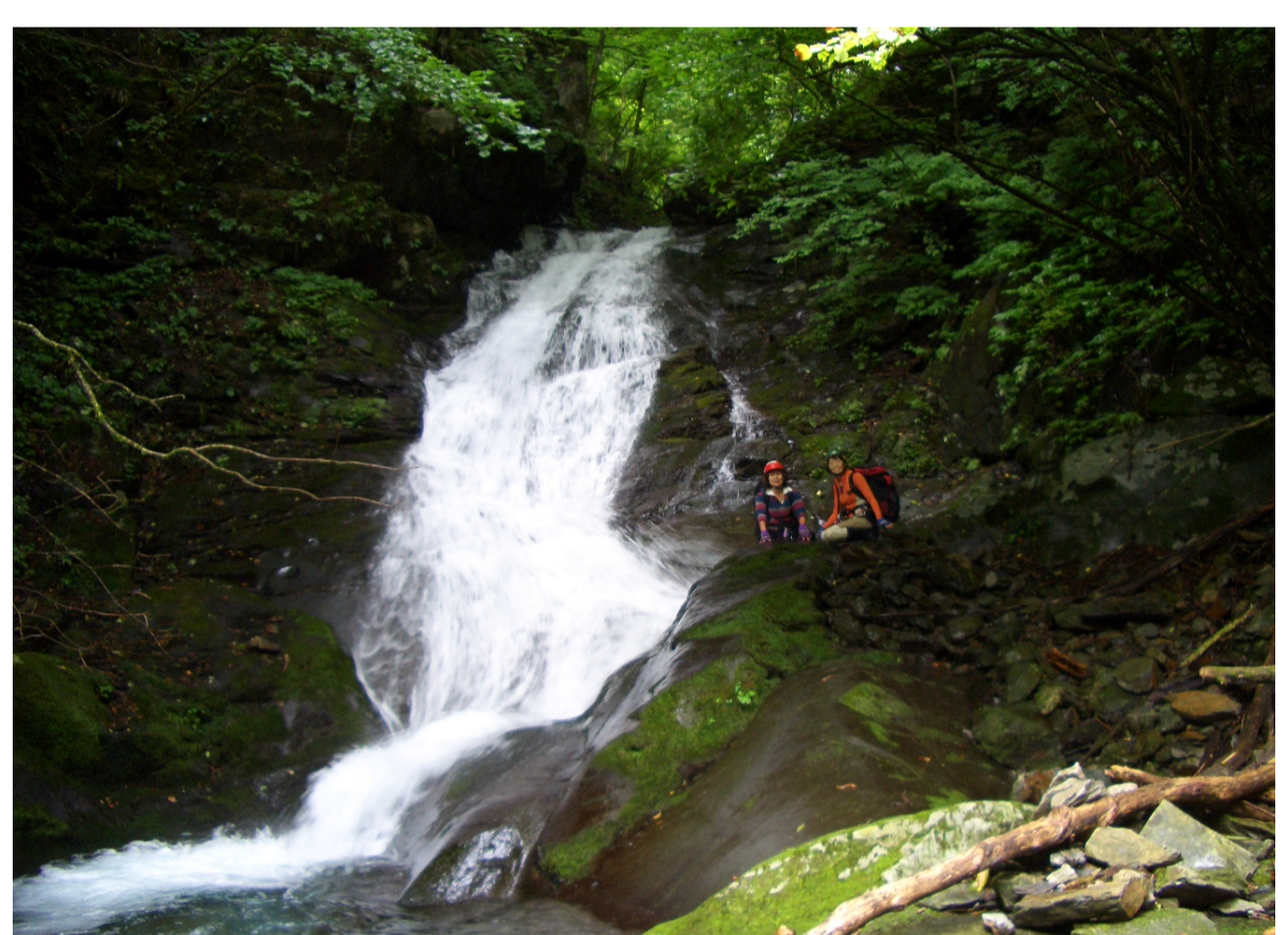
美しい滝でございます！やあ、もちろん美女も！