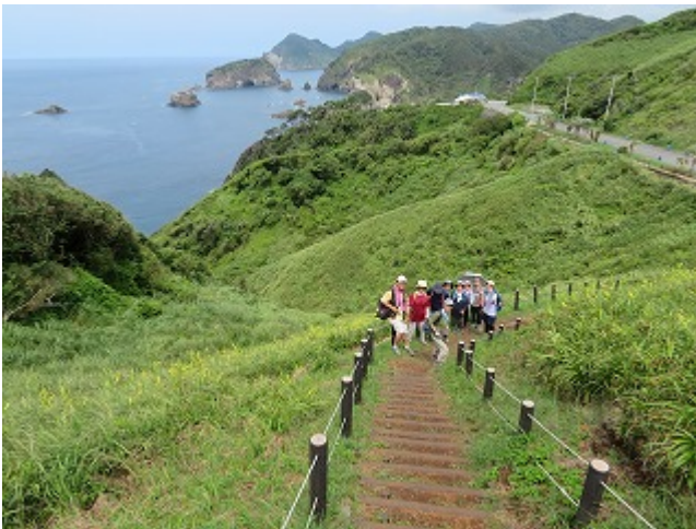
第 13 回 2019/07/24 石廊崎港～海蔵寺 第 14 回