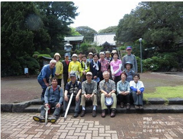
第1回 2018//4/25 伊東・汐吹岬～八幡野港

昨日は、12月度・伊豆一周ウォーキングで下田・爪木崎した。同時に、2018年4月25日から二年半続いたウォーキングの最終回でした。