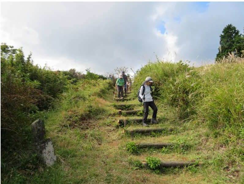
第 15 回 2019/10/23 山中城跡～熱海・般若院

2年半で女子班は、都合3回料理を提供してくれた。下田・青野川、お花見は＝豚汁、大室山・桜公園＝お汁粉、そして今回。手間・労力と面倒だが、いつも奮闘をいただき感謝・感謝でした。午後は、蓮台寺・金谷旅館＝千人風呂で温泉もあったが、コロナで断念。