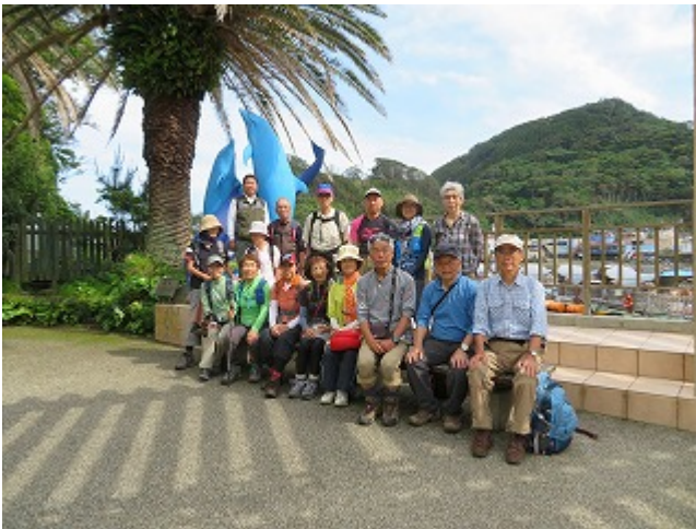
第 11 回 2019/05/22 須崎～海中水族館