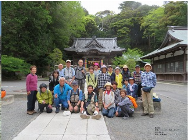
第10回 2019/04/24 河津～竜宮島～須崎

無料駐車場から少し歩いてスイゼン畑着。スイゼンは、場所に寄って咲き方に差はあるが、おおむね花盛り。周囲には、いい香りも漂っていた。