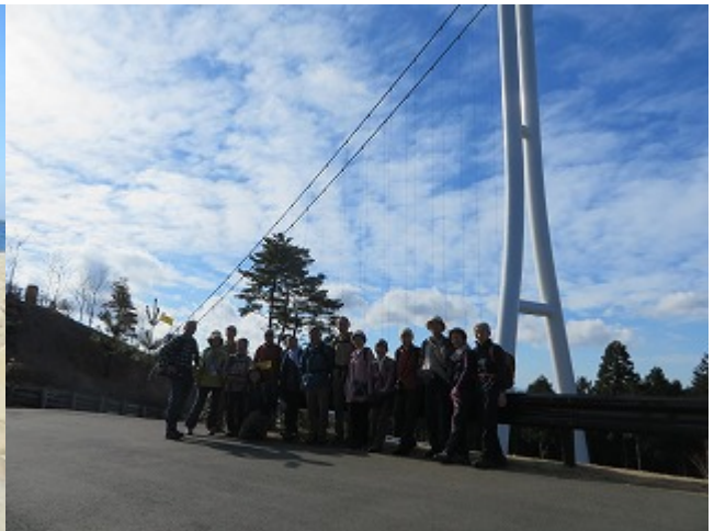
第6回 2018/12/19 三嶋大社～山中城跡