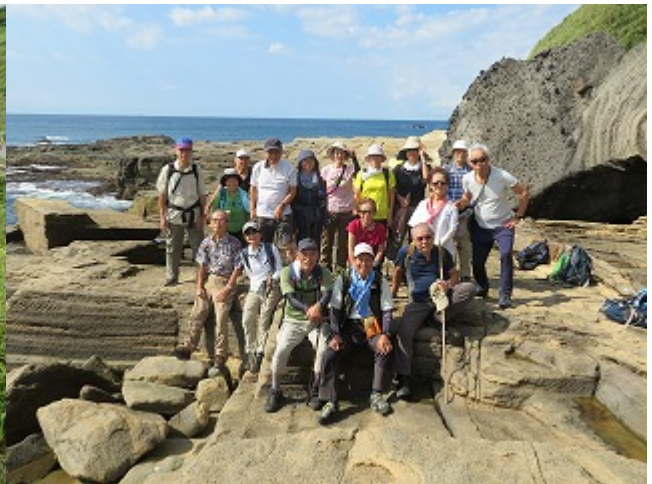
第 14 回 2019/09/25 入間～吉田