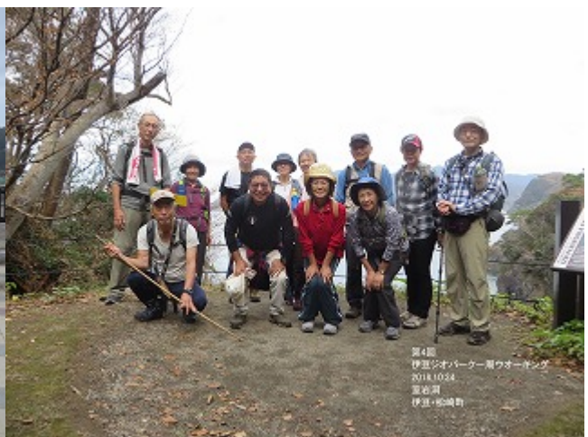
第4回 2018/10/24 石部～堂ヶ島・トンボロ

当初の計画は、柿田川公園～源兵衛川～三嶋大社の予定でしたが、爪木崎のスイセンがよいで、急遽、計画変更になりました。