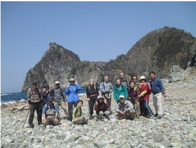
第9回 2019/03/27 高通山～雲見靈廟