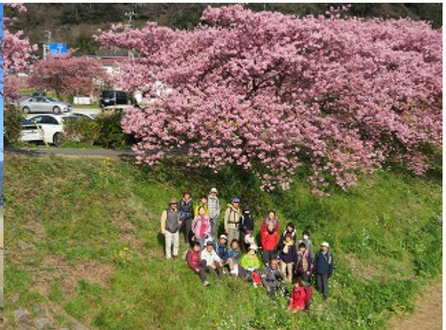
第8回 2019/02/27 下田・青野川