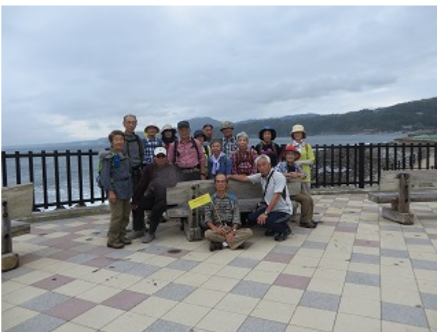
第3回 2018/09/26 片瀬白田駅～河津