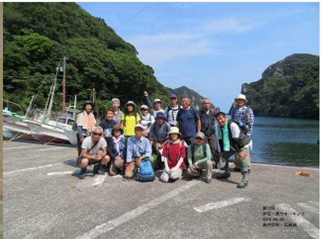
第 12 回 2019/06/26 海中水族館～石廊崎