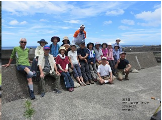
第2回 2018/06/27 八幡野港～片瀬白田駅