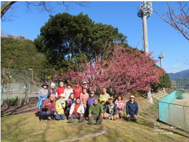
第7回 2019/01/23 恋人岬～小土肥地先