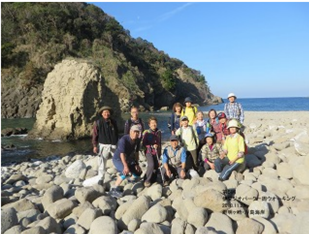
第5回 2018/11/28 堂ヶ島・トンボロ～安良里