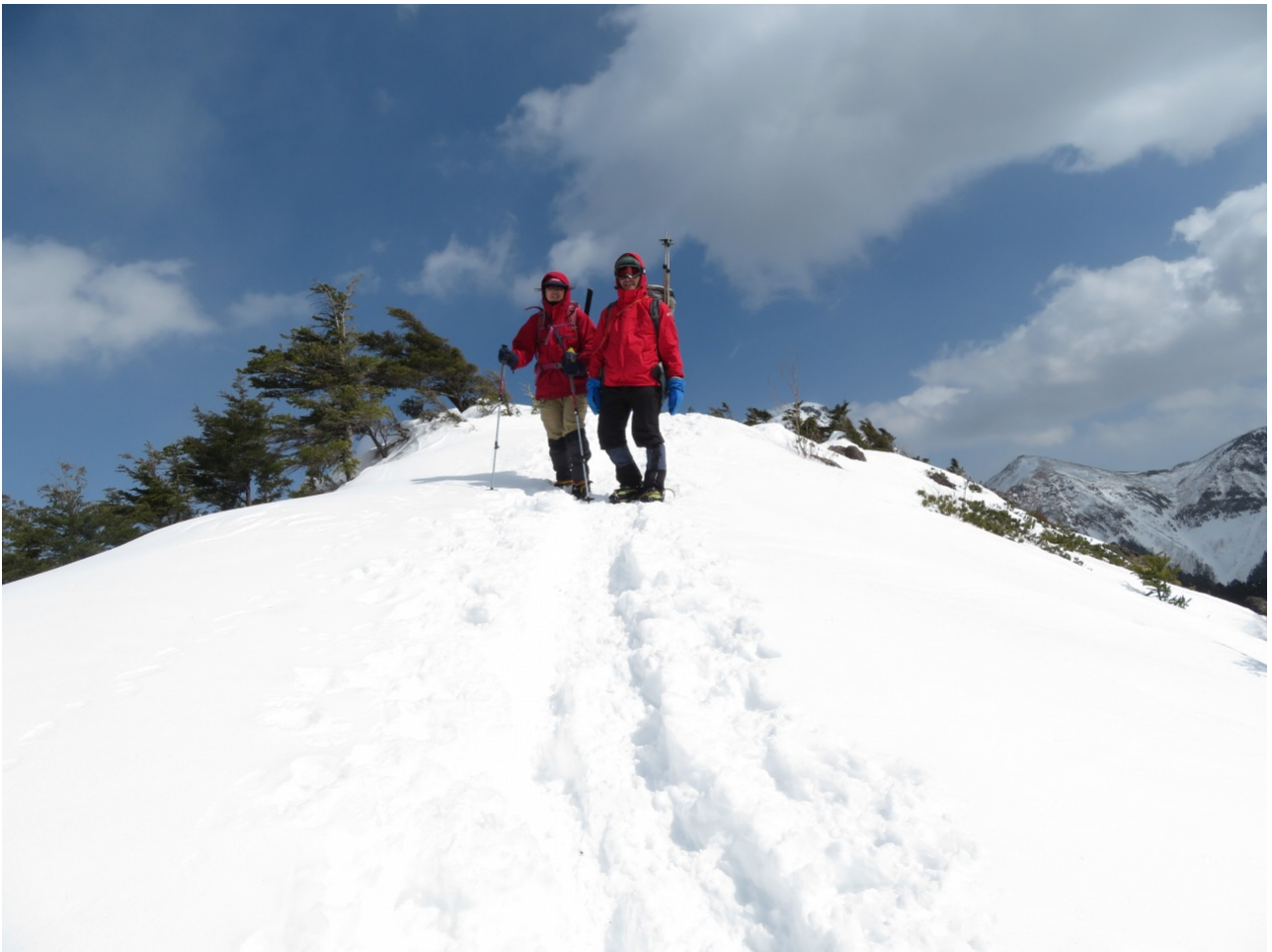
下山・第一高点付近